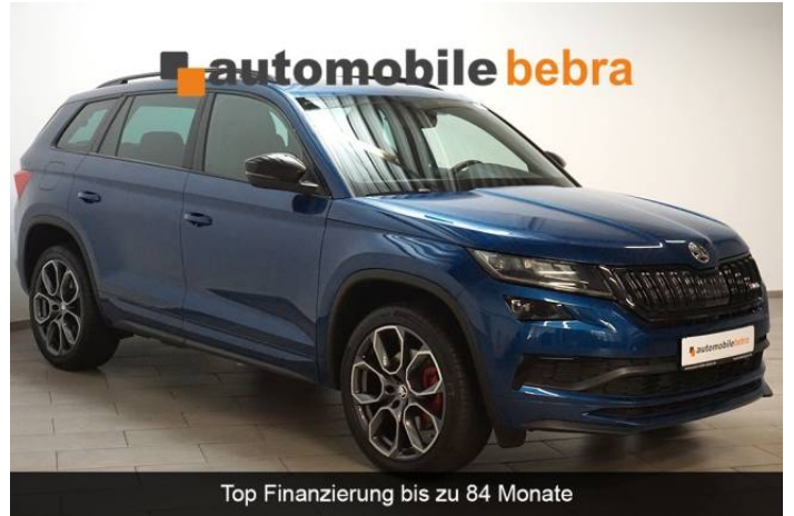
Top Finanzierung bis zu 84 Monate