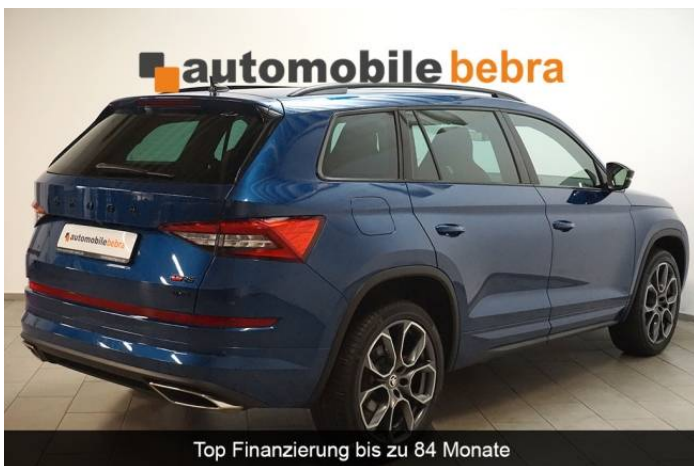
Top Finanzierung bis zu 84 Monate